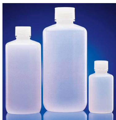
HDPE, naturel PP, naturel