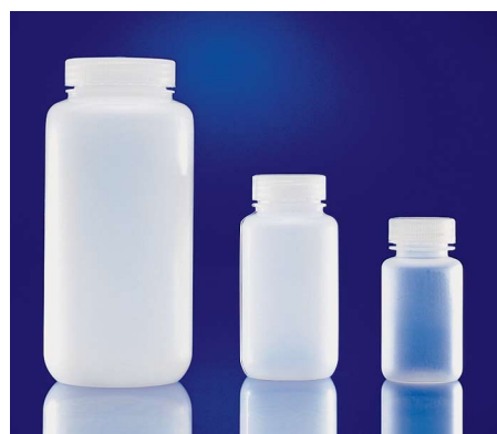
Large embouchure, naturel