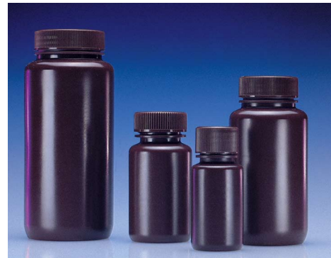
Weite Öffnung, dunkelgelb