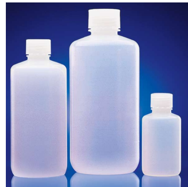
HDPE, Natur PP, Natur